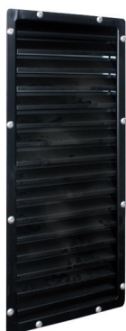
Inlopp air grid