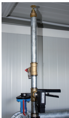
Sprinkler för Skydd Av Tekniska Tak