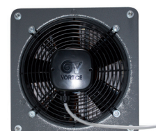
Fläkten luften utvisning