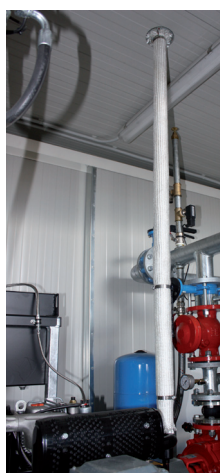
Röker outlet kanal