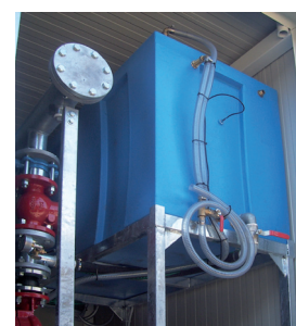
Akkumulatortank vid abovehead montering